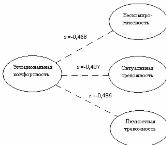
Рис. 2. Графическое отображение корреляционных связей показателей социально-психологических факторов суицидального риска

А показатель «эмоциональная комфортность» отрицательно связан с бескомпромиссностью ( r = -0,468 ), ситуативной ( r = -0,407 ) и личностной ( r = -0,486 ) тревожностью (рис. 2).